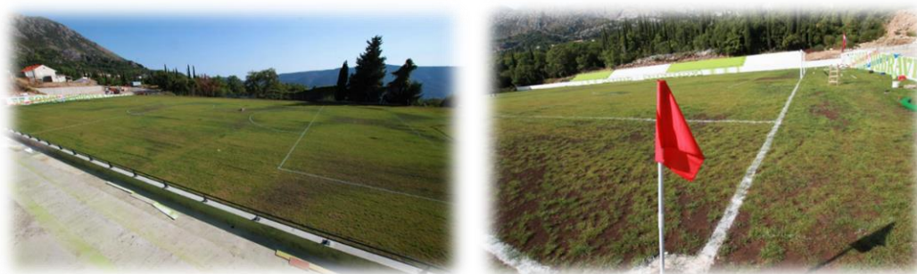
Slika 1. Nogometno igralište u Dubravci

Općina Konavle je Ministarstvu državne imovine 27. lipnja 2019. godine podnijela zahtjev za izdavanje isprave podobne za upis vlasništva za nogometno igralište u Grudi, ali za navedeno još nije dobila odgovor.